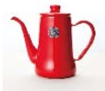
野田琺瑯 月兔ポット ¥3,150